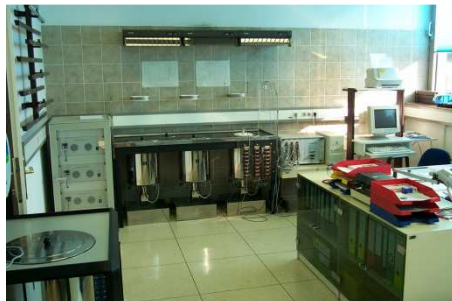
Slika 3: Preskusna naprava Termokal in Kompukal

Za kompaktne izvedbe merilnikov se uporablja preskusno postrojenje Enerkal.