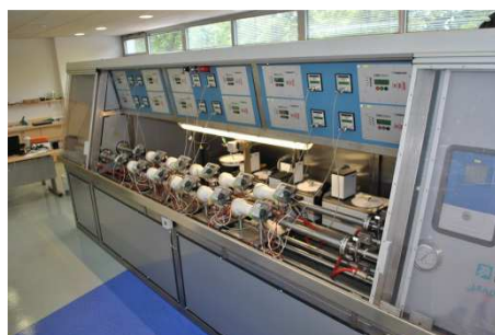
Slika 4: Preskusno postrojenje Enerkal

Za kompaktne izvedbe merilnikov se uporablja preskusno postrojenje Enerkal.