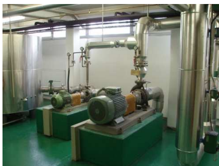
Slika 1: Tehnološki del postrojenja Volukal

Za merilnike pretoka razstavljenih konstrukcij uporabljamo preskusno postrojenje Volukal, v katerem se stalno vzdržuje ca. 7 m 3 na temperaturi 50°C. Na tem postrojenju lahko opravljamo kontrole merilnikov dimenzij od DN 15 do DN 150 mm.