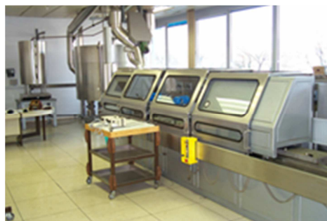
Slika 2: Preskusni pult - Volukal

Računske enote kontroliramo na napravi Kompukal, kamor se priključi računska enota. Pri kontroli se iz naprave generira temperaturna razlika dovoda in povratka ter pretok, kot v realnih pogojih delovanja. Preko izhodnega signala iz računske enote sprejemamo izmerjeno vrednost toplotne energije v času kontrole za vsako posamezno meritev.